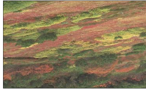
移ろいゆく季節 北海道 大雪山系黒岳