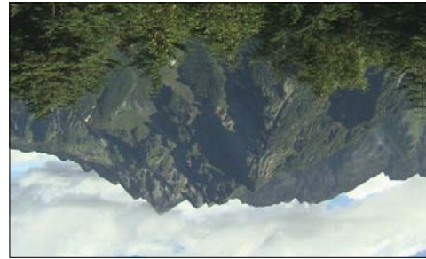
長野県 穂高峠 霧沢岳