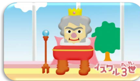
3月18日放送 イスワル3世 (市村 正親)