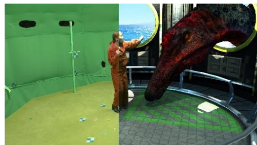
(左)撮影の様子 (右)撮影後に画像処理してリアルな映像を生成

被写体の3次元形状や模様などの情報を精緻に取得し、リアルな質感を再現する技術です。撮影後に、視点や質感、照明の当たり方を自由に変更できるほか、アニメ風に加工するなどさまざまな映像表現が可能です。