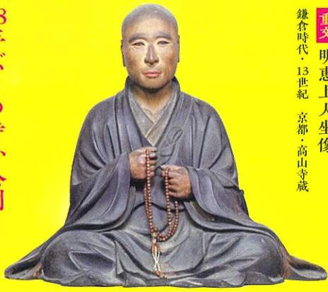
重文 明恵上人坐像 鎌倉時代・13世紀 京都・高山寺蔵

「鳥獣戯画」が伝わる京都の高山寺は、鎌倉時代の僧、明恵上人によって再興され、今も多くの美術品が伝来しています。本展では、重要文化財「明恵上人坐像」をはじめとする高山寺選りすぐりの名宝などから、明恵上人の魅力にも迫ります。