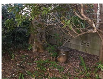
ここにいた！という場所の様子も