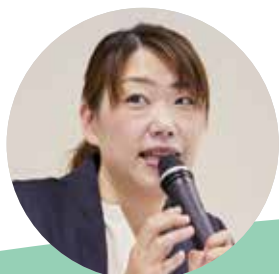
執筆者 北海道石狩市立双葉小学校 教諭 前多香織

また、ティーチャーズ・ライブラリーには、すでにラインナップされている情報モラル番組があります。あわせて視聴したり、部分視聴したりするとより効果的に活用することができます。