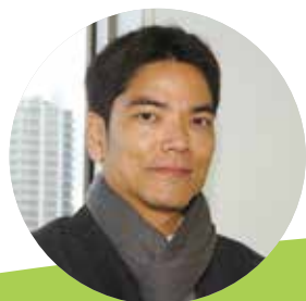
執筆者 宮古島市教育委員会 教育研究所 指導主事 座間味浩二

一過性に終わらないよう、取り組みに際して起こりうる障害を予測したり、その障害を乗り越える対応策・改善策を考えて共有したりする機会を、学習の中で子供たちに与えることが望まれます。総合的な学習の時間で、環境教育をテーマにした探究的な活動として扱うとよいでしょう。