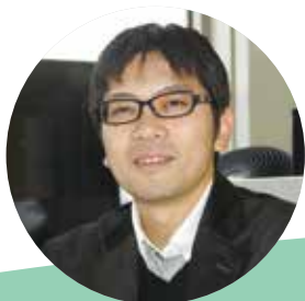
執筆者 向日市立寺戸中学校 教諭 鈴木英太

日常生活でスマートフォンやパソコンなどインターネットを活用することは当たり前の時代となっています。世代を問わず、私たちの生活スタイルは少し前からは想像もつかないほどの変化の中にあると言えますが、これから先の時代は新しい技術が次々に開発され、これまで以上に予測不可能な社会になっていくと考えられます。新しい時代を力強く生きるため、必要な情報を取捨選択し、自らの意見をもち判断していくことの重要性について考えることができます。