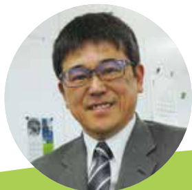
執筆者 安来市立広瀬中学校 教諭 瀬崎邦博

エネルギーについて、より多面的な見方や考え方を育むために、他のティーチャーズ・ライブラリーの番組を活用すると効果的です。コラムで紹介している「蓄エネルギー技術」を分かりやすく紹介した番組『サキどり↑電気をためて暮らしを変える!“蓄エネ”最前線』を活用することで、これからの日本のエネルギー問題について、より深く多面的に考えることができます。