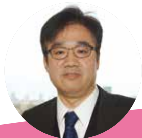
執筆者 西条市教育委員会 指導担当専門員 山内雅博

動物救急病院には、交通事故に遭った野良猫、介護の必要な老犬、熱中症にかかったウサギなど、さまざまな症状の動物が運び込まれてきます。森さんは7日間の動物看護師体験の中で、病状に応じてきめ細かに対応し、人間に対するのと同様に接する医師や動物看護師の態度を見て、人間も動物もなくかけがえのないいのちを大事にしていることに気付きます。動物看護師の姿から、いのちの尊さやいのちあるものを大切にすることについて、改めて考え、勤労観・職業観を培うことができます。