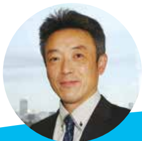
執筆者 能代市立能代南中学校 教諭 嵯峨静人

番組は、核ミサイルの誤発射により海中に核ミサイルが沈んだこと、その事故が隠蔽されていたことを明らかにします。当時の兵士の「これが爆発していたら那覇が吹き飛んでいた」との証言が衝撃的です。また、1962年のキューバ危機の際の、核ミサイル発射可能な状態を表す「HOT」という文字が映像で流れ、核戦争寸前という緊迫感を感じることができます。これらのことから、現在の平穏な自分の生活と照らし合わせ、核兵器や核戦争の恐ろしさを学ぶことができます。