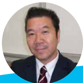
執筆者 大分県立大分商業高等学校 教頭 森 浩三

平和学習を進めるにあたり、私たちが平和のためにできることを考えることは重要です。NHKティーチャーズ・ライブラリーの、「平和」ジャンルの番組を合わせて視聴し、様々な視点から平和の尊さ、戦争の悲惨さについて改めて考え、自分たちのできることを考え、実践することで、平和で持続可能な未来を創造する態度を育みます。