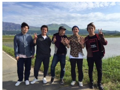
アカペラグループ よかろうもん