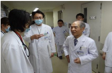
がんを生きる医師たち

今、2人に1人ががんになる時代。医療の日進月歩で、新しい治療や薬が次々と生まれる中、がんは「不治の病」から、「治せる病」に変わりつつある。しかし、いざ、「あなたはがんです」と告げられた瞬間、ほとんどの患者や家族はさまざまな不安に襲われる。「本当に治るの?」「自分にぴったりの治療は?」「生活は守れるの?」…。3時間のスタジオ討論を通して、今がんについて知っておくべき新常識を紹介する。