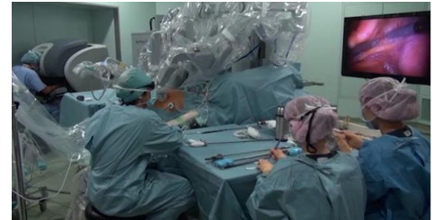
最新の放射線治療装置