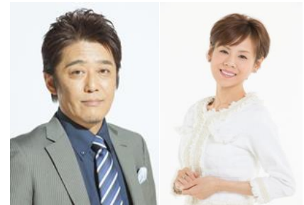
MC 坂上忍 MC 高橋真麻

スタジオには、がん詳しい6人の専門医が集まり、誰もががんになったとき、身に降りかかってくる問題や疑問について議論する。その専門医は全員、実は、自らもがんを患った経験がある。彼らが、がんになったとき、どんな事態に直面し、どのように向かい合い、乗り越えてきたのか。