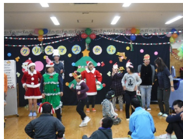
障害児入所施設わかふじ寮でのクリスマス会（高知県）