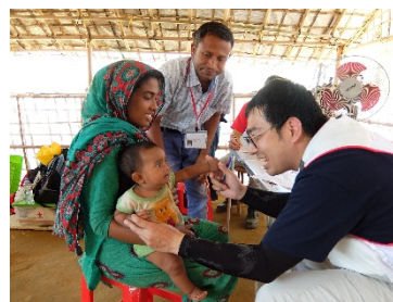
仮設診療所で診療にあたる日赤医師（バングラデシュ）