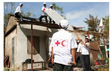
台風の影響で被害を受けた住居の再建（ベトナム）