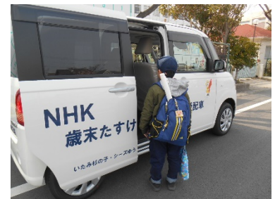
いたみ杉の子“シーズゆう”の送迎車両（兵庫県）