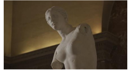
Images des collections et des espaces du musée du Louvre – Paris /Coproduction 8K NHK-Musée du Louvre

〈ミロのヴィーナス〉〈モナ・リザ〉〈ナポレオンの戴冠〉をはじめとする、世界の至宝9点を撮影。「HDR」や「広色域」など、明るさや色の表現を広げる最新の技術を用いて、手を伸ばせば美術作品そのものに触れられるかのような質感と立体感を再現。8Kが可能にした新たな「作品との出会い」を伝えるとともに、あたかも館内にいるような臨場感を体験いただきます。