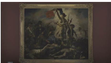
Coproduction 8K NHK - Musée du Louvre

第4集は19世紀から20世紀、激動の時代。近代化の中で求めた永遠の美とは何か? 難破船の生死の極限を描いた「メデューズ号の筏」、フランス7月革命を描いた「民衆を導く自由の女神」が生まれ、埋もれていた宗教画の傑作「アヴィニョンのピエタ」が発見されます。そして、発掘された古代ギリシャ彫刻「ミロのヴィーナス」がルーブルに。多様な至宝が、語りかけてきます。