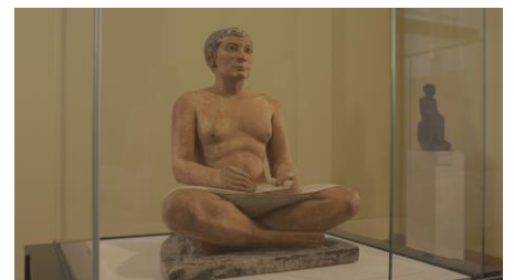
Coproduction 8K NHK - Musée du Louvre

第3集は18世紀末から19世紀初頭。革命後、ルーブルは共和国美術館として生まれ変わります。そして登場したナポレオンは、ルーブル最大の絵画「カナの婚礼」を戦利品としてもたらし、自らを大作「ナポレオンの戴冠」に描かせます。エジプト遠征は、ヨーロッパに古代エジプトブームをよび、紀元前26~24世紀のエジプトの傑作「書記座像」もルーブルに登場。ナポレオンの夢と野望が、ルーブルに、新たな芸術の扉を開きました。