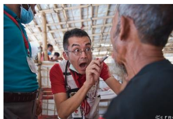
不衛生な環境で病気にかかる人々の救護(バングラデシュ)