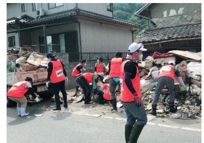
西日本豪雨災害ボランティアセンターの運営を支援(岡山県)