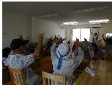
高齢者の認知症予防のため「ふれあいサロン」を開設(愛知県)