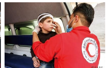
子どもの手当てを行う医療スタッフ(シリア)