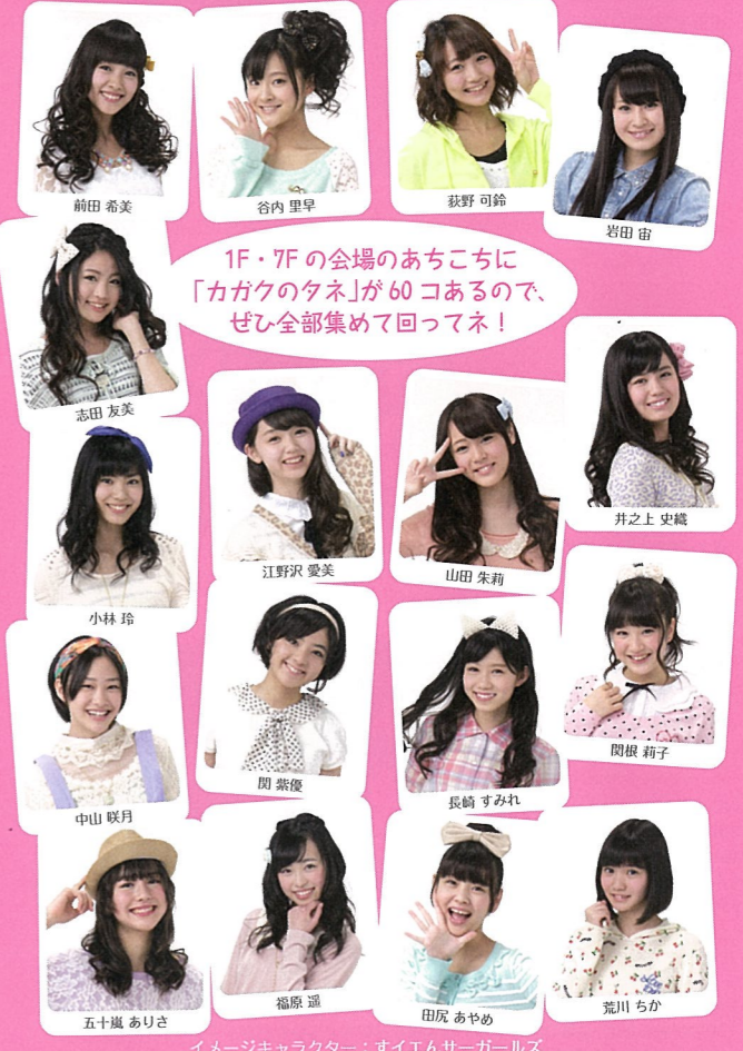
イメージキャラクター: すいエンサーガールズ

サイエンススタジアムの会場のあちこちを回ると、テレビ60年にちなみ、カードに書かれた「カガクのタネ」を60種類ゲットできます! それぞれの科学番組にちなんだクイズや名言などが書かれた、ここでしか手に入れない超レアアイテム! 60種類がどこにあるかは秘密! 会場内をくまなくさがしてみよう! (対象:中学生以下) ※数がなくなり次第、終了させていただきます。