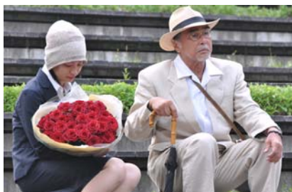
文化庁芸術祭（テレビ部門）大賞 広島発ドラマ「火の魚」