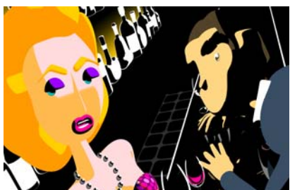
国際エミー賞 特集「星新一 ショートショート」