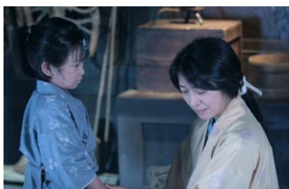
ABU賞（ドラマ番組部門） 天地人 第2回「泣き虫与六」