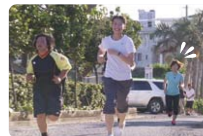
本部高校 ゴルフ部

本部町には30店舗を超える喫茶店があり、自然の中でゆったりと食事を楽しめると人気です。