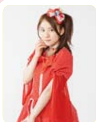
埼玉 いるま 入間しおり

福岡のアイドルグループ「親不孝ドールズ」からGMTのメンバーに。だが、本当は佐賀県出身で、地元への愛情も人一倍強い。「アメ女」のピンチヒッターとしてGMTでは初めて舞台上立つが早着替で失敗してしまう。