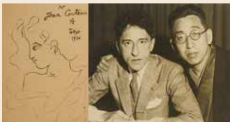
来局時にジャン・コクトーが描いた絵 (写真はコクトーと堀口大学)