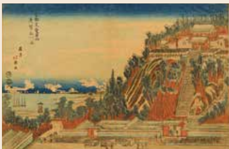
昇亭北寿「東都芝愛宕山遠望品川海図」