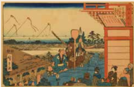
歌川広重「江戸名所 芝愛宕山吉例正月三日毘沙門之使」