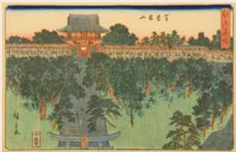
歌川広重「江戸名所 芝愛宕山」