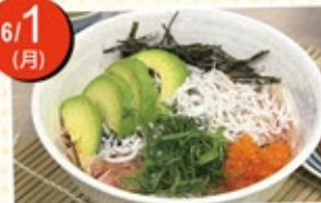
とん 釜揚げちりめん丼