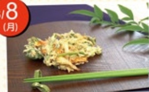
ちりめんと野菜のかき揚げ