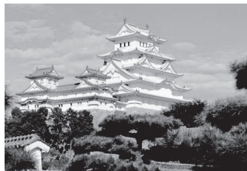
Castelo de Himeji