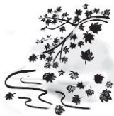
AKI (ဆောင်းဦး)