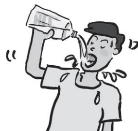
形容大口大口喝东西的声音。