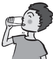
形容咕咚咕咚地喝东西的声音。