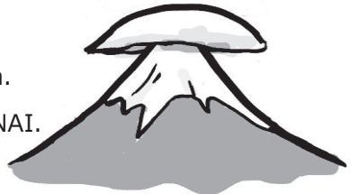
KASAGUMO: una nube con forma de sombrero

◆ Si la partícula TO viene después de un verbo, indica una condición. Antes de TO, los verbos adoptan la forma diccionario o la forma NAI. Ej.) ANO KUMO GA MIERU TO , AME GA FURIMASU. (Cuando se ve esa nube, va a llover).