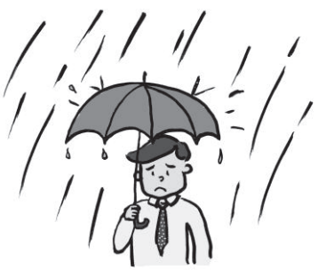
El sonido de la lluvia torrencial.