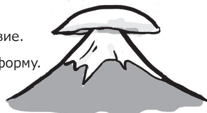
KASAGUMO : облако в виде шляпы

(Когда видите такое облако, будет дождь.)