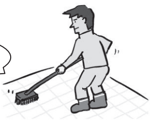
Ni sauti ya kusugua.