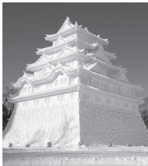
Снежный фестиваль в Саппоро

Хоккайдо привлекает многих туристов прекрасной природой и очаровательными пейзажами. На территории Сирэтоко, внесенной в Список Всемирного природного наследия ЮНЕСКО, в естественных условиях живет множество диких животных. Зимой на Хоккайдо можно посетить фестивали снега и заняться зимними видами спорта - например, покататься на лыжах. В зоопарке Асахияма в Асахикава можно посмотреть, как пингвины гуляют по снегу.