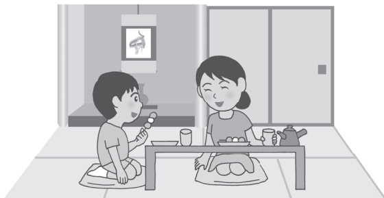
Комната в японском стиле

Полы в комнатах европейского стиля деревянные или с ковровым покрытием. Обычно в таких комнатах пользуются столами и стульями. Сегодня комнаты в европейском стиле встречаются все чаще. Во многих домах есть оба вида комнат.