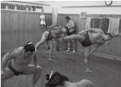
Latihan pagi hari

Beberapa sasana sumo mengizinkan penggemar untuk melihat latihan di pagi hari