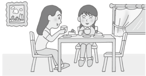
Ruangan gaya Barat

Ruangan gaya Barat lantainya dilapisi kayu atau karpet, dan biasanya terdapat bangku dan meja. Saat ini semakin banyak rumah yang menggunakan ruangan gaya Barat, tetapi ada banyak juga rumah yang memadukan dua gaya tersebut.