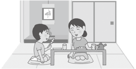
Ruangan gaya Jepang

Ruangan gaya Barat lantainya dilapisi kayu atau karpet, dan biasanya terdapat bangku dan meja. Saat ini semakin banyak rumah yang menggunakan ruangan gaya Barat, tetapi ada banyak juga rumah yang memadukan dua gaya tersebut.