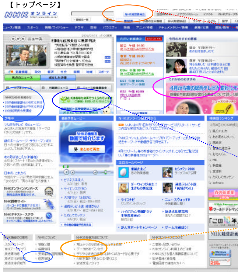
【各コンテンツを充実】

トップページをより見やすく工夫し、経営に関する最新情報をわかりやすく表示するとともに、さまざまな経営情報にも簡単にアクセスできるようにしました。