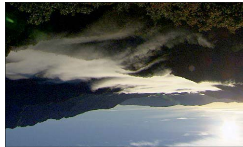
新潟県 越後駒ヶ岳