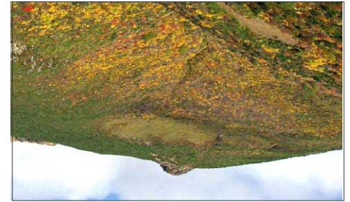
福島県 安達太良山