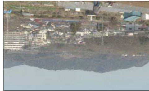
東京都 高尾山 「都会のそば」