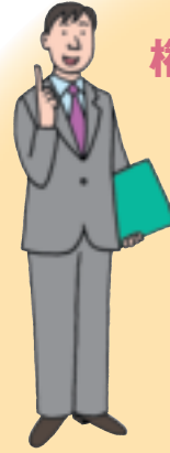
番組編成の 担当者