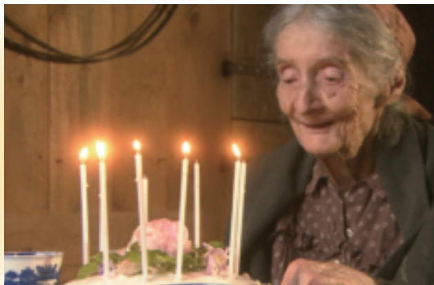
「ターシャからの贈りもの 魔法の時間の作り方」

また19年1月から、衛星第2テレビで、毎週土曜と日曜に「あなたのアンコール」として、再放送希望の多い番組を中心に放送をしています。