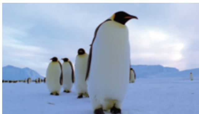
NHKスペシャル「プラネットアース 第1集 生きている地球」