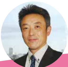
執筆者 藤里町立藤里中学校 教諭 嵯峨静人

また、かけがえのない命の大切さについて考えるために、道徳の「生命の尊さ」の内容項目の教材としての活用が考えられます。番組内のハンセン病患者に対する差別の事例から、現代社会に見られる様々な病気や障害に苦しむ人々の思いにつながることで、命の大切さをより広く考えることができることでしょう。